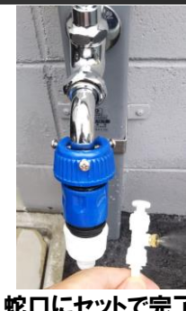
蛇口にセットで完了