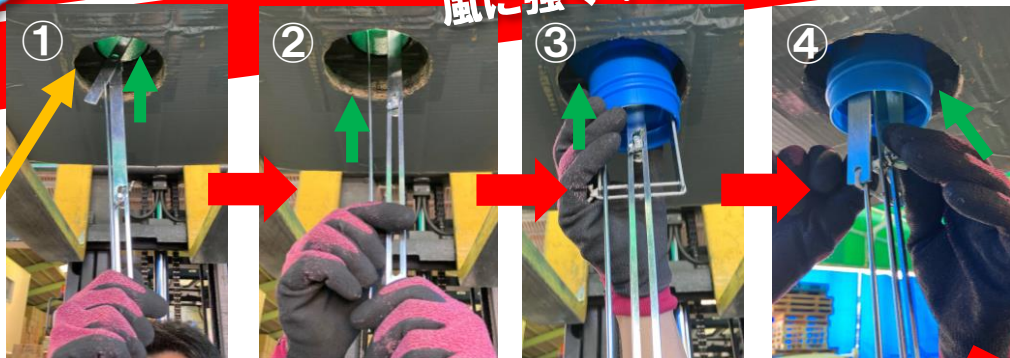
ドレンの イメージ